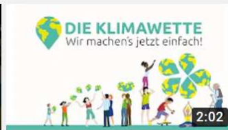
Die Klimawette - wir machen's jetzt einfach