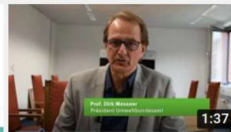
Grußwort von Dirk Messner, Präsident des...